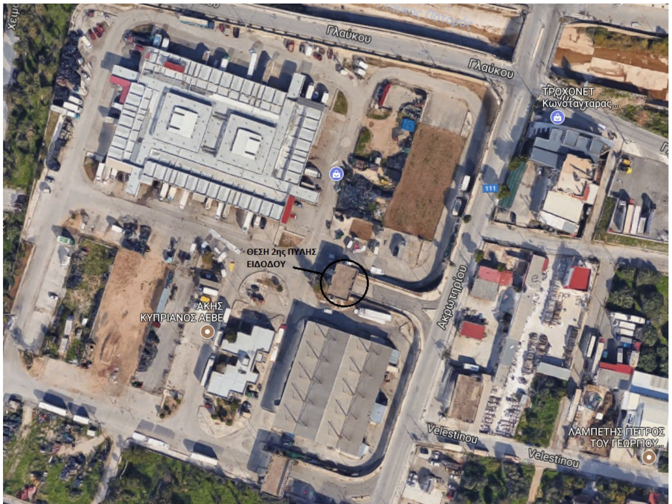
Σκαρίφημα 2: Κεντρική Λαχαναγορά Πατρών, θέση 2 ης πύλης εισόδου

ΑΦΕΝΤΡΑ ΣΑΝΤΑ ΔΙΕΥΘΥΝΤΡΙΑ ΥΠΟΣΤΗΡΙΚΤΙΚΩΝ ΛΕΙΤΟΥΡΓΙΩΝ